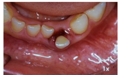
乳歯の下顎前歯が大きくずれている

歯全体が動く、位置や向きが変わった等の症状がある場合、歯が脱臼していたり根が破折、場合があります。歯を元の位置に固定して、定着するか経過を観察します。