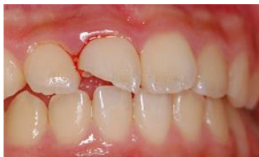
上顎永久前歯の中程度の破折

歯髄を残せる場合は保護をしてから樹脂で欠けた部分を修復します。歯髄への傷害が大きい場合歯髄を取って差し歯を被せる方法で修復します。