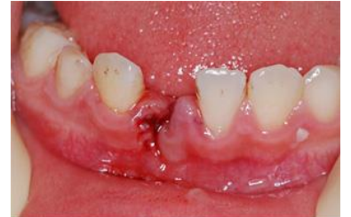
下顎の永久前歯が抜け落ちた(脱落した)

歯が根ごと完全に抜けてしまった状態です。抜けた歯は根の部分に触らず、保存液もしくは牛乳に浸けてお持ちください。戻せない場合もあり、歯を補う治療が必要となります。