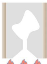
電気炉で焼却するとワックスで作った部分はすべて焼けて空洞になる(鋳型)