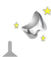
スプルーを切り、形を整えて磨いて完成