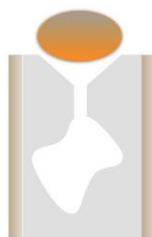
金属を溶かして鋳型に流し込む