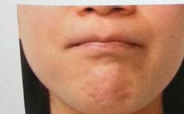
図3 頬を膨らませるトレーニング（リップパッファー）