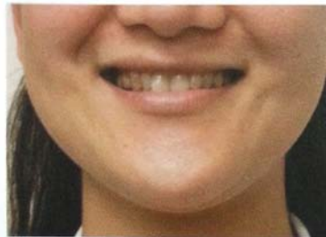
図1 リップトレーニング「イー」